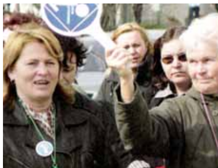
Митинг работников Skoda