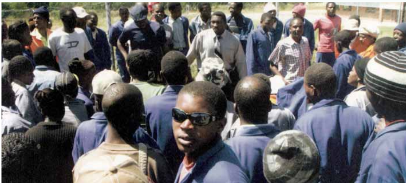
Члены SATU во время забастовки в апреле 2007 года