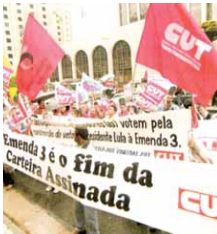
Митинг в защиту права на социальные гарантии

Двумя месяцами раньше президент Лула подписал закон о создании «Super-Receita» — общественной организации, которая должна объединить функции федеральной налоговой службы и службы социального налогообложения. Однако он наложил вето на противоречивую «Поправку 3», с большим преимуществом поддержанную Конгрессом. Эта поправка запрещала сборщикам социального налога принимать решение о том, является ли «самозанятый» специалист настоящей «компанией» или обычным индивидуальным налогоплательщиком, что стало бы препятствием для работников с нестандартной занятостью в получении социального стра-