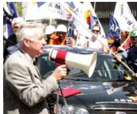
Митинг рабочих Thales в Garden Island

Thales выразила свою приверженность Global Compact ООН, включающему требование «эффективной реализации права на коллективные переговоры». Политика компании направлена в целом на соблюдение международных трудовых стандартов, выраженных в документах Международной организации труда.