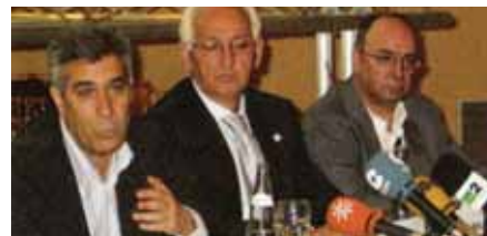
Пресс-конференция на заводе Delphi, Севилья

Исполнительный Комитет МФМ в очередной раз сделала акцент на своей