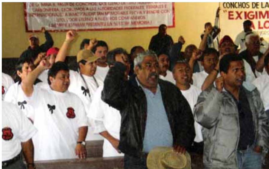
Рабочие в Паста-де-Кончос, февраль 2007.